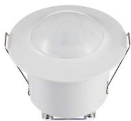
TG MD360 DE WH