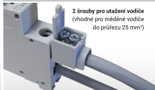
2 šrouby pro utažení vodiče (vhodné pro měděné vodiče do průřezu 25 mm 2 )