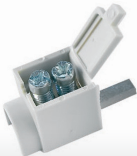
Připojení do přístrojů pomocí konektoru kolík (jazýček)